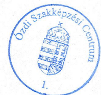
Tóth Béla főigazgató